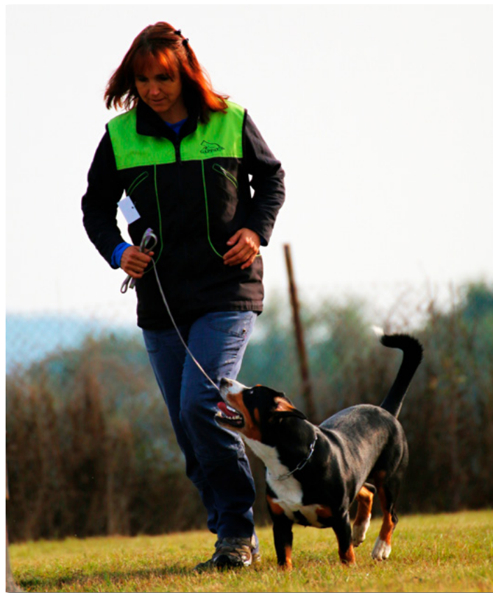
| Treibball je sport, ve kterém pes podle povelů pracuje s gymbally ve vzdálenosti od psovoda.

Vzhledem k tomu, že s postupujícím časem přicházely ze zahraničí další „psí sporty“, mohla se cvičitelka psů poohlédnout po jiné aktivitě. Před několika lety ji tak zaujal ve Spojených státech amerických zcela nový sport s názvem „treibball“. Entlebušští