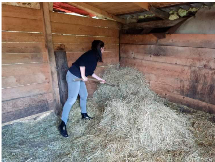
| Ještě před zahrnutím koní zpět do boxů a podáváním večere jsme nanosily seno do boxů.

mini). „Bohužel ale už není tolik volného času, který bych tomu ráda věnovala, a tak jsme od tohoto plánu museli upustit,“ sděluje. Alena a Tomáš Křenkovi se rozhodli proto turistické jízdě a začátečnickům věnovat pouze okrajově a mít koně už spíše jen a pouze pro sebe a pro jejich „stálá“ děvčata, což prozatím vedlo k tomu, že dali už jednoho koně pryč z důvodu nevyužití a v dohledné době půjdou do světa i miniponici.