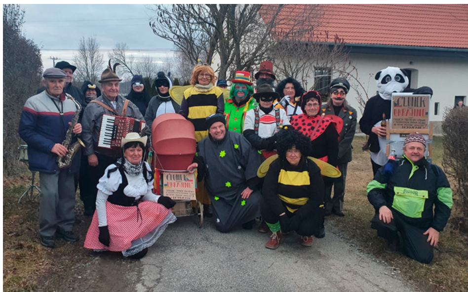
| Počasí maskám zrovna nepřálo, i tak rozdávaly pozitivní energii. Jejich smích a zpěv byl slyšet v celé vsi.

Vsí se ten den procházela řada postav, potkat jste mohli berušku, vodníka, Rumcajse, pandu, včely, kouzelníka, psůvoda a další. Celkem 15 masek doprovázeli tři muzikanti. Ti s nimi potom ještě zašli do klubovny. „Tam se hrálo a zpívalo,