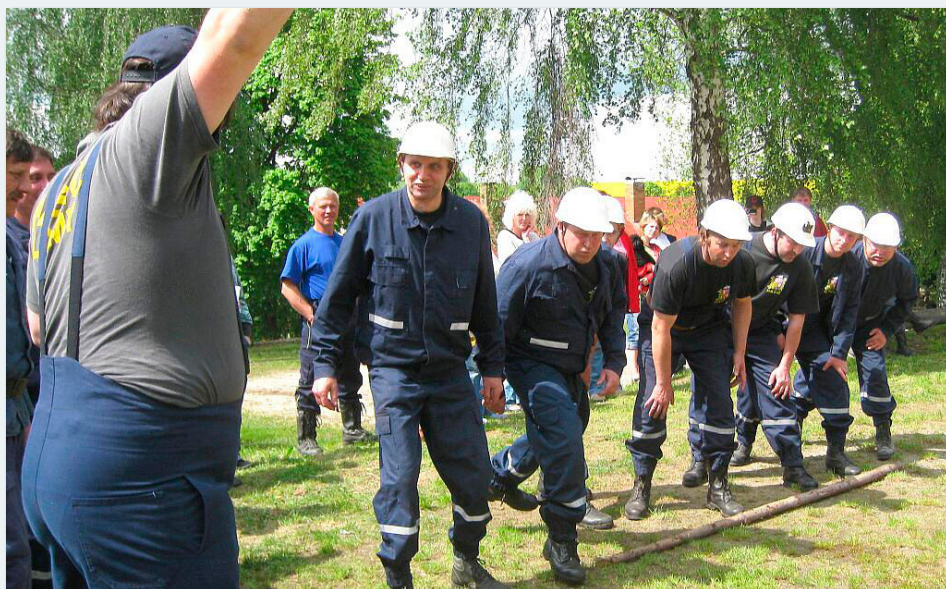
| Soutěžní družstvo z Lomů při příležitosti 75. výročí založení sboru v roce 2010.

V současné době čítá sbor 11 registrovaných členů, jejichž věková hranice je od 18 do 76 let.