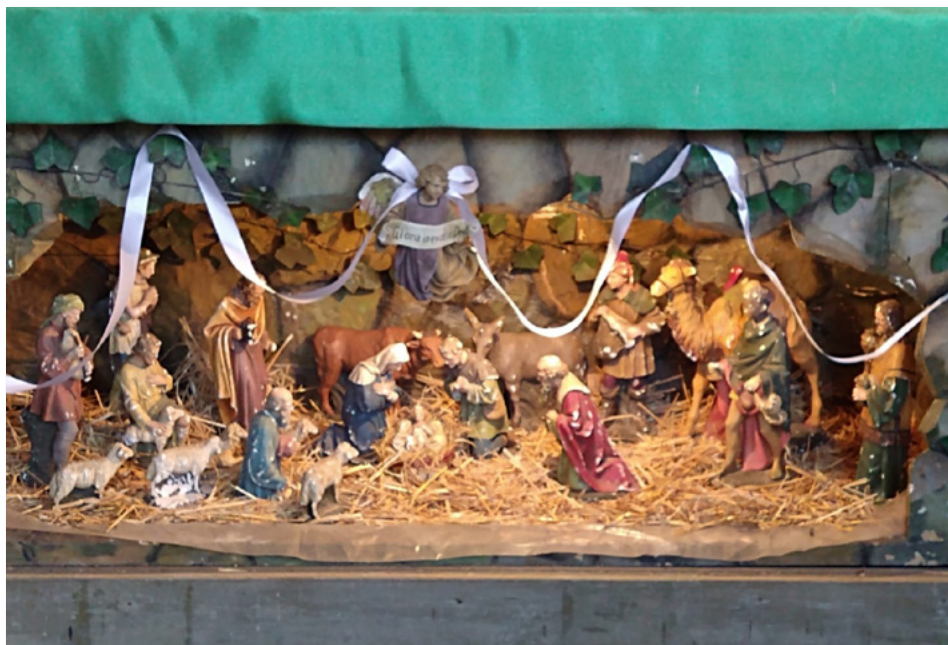
| Betlém ve člunckém kostele se vystavuje o Vánocích. Ovšem pokud by měl někdo zájem vidět ho dříve, Petr Petrucha mu vyhoví.

V zadní části kostela stojí zpovědnice. „Ta nefunguje, je napadena dřevomorkou a nejen ona. My tady ale nehřešíme, tak ji ani nepoužíváme,“ říká se smíchem. „Na Moravě je pojmání víry plnější, tam byste viděli před zpovědnicí fronty,“ pokračuje. Při pohledu na hlavní vchod do kostela