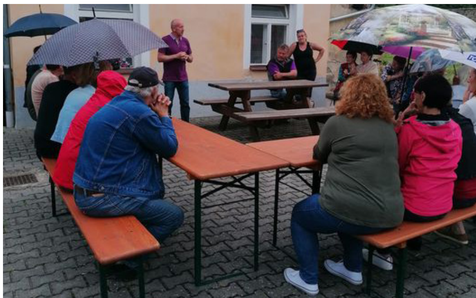
Ve Člunku zúčastněným nevadilo ani deštivé počasí.