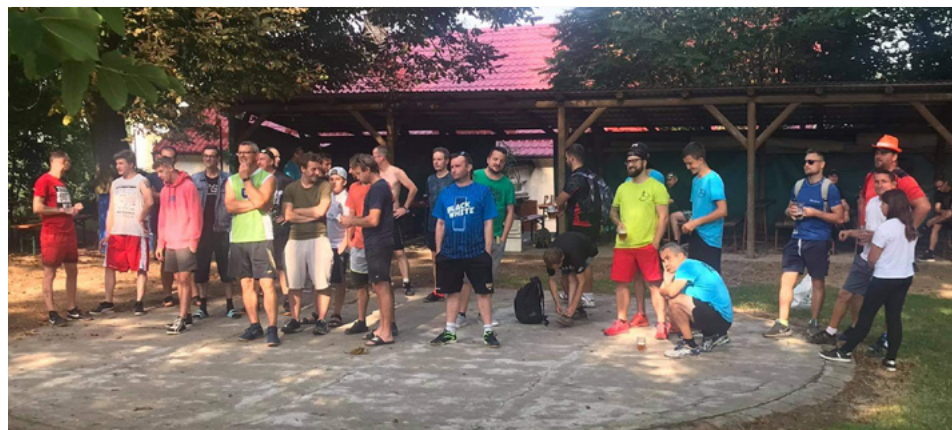
| Vyhlášení výsledků v Lomech.