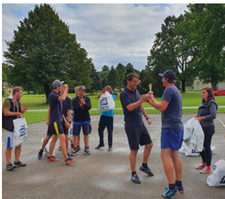
| Tým Pokémoni si přebírá pohár za třetí místo.