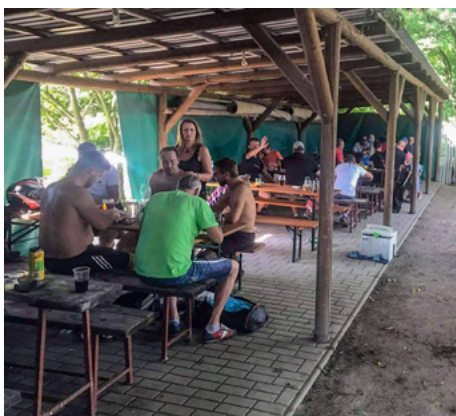
| V Lomech si pochutnali hráči a fanoušci na tradičním bramboráku.