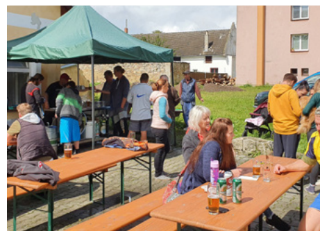
| Na nohejbalový turnaj dorazila i veřejnost. Neodolali místní višňovce a sekané v housece.