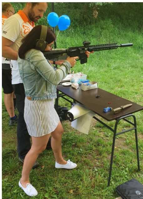
| Sama jsem si také musela vyzkoušet některé zbraně.

Ještě si musíme potěžit vojenský batoh vážící 15 kg. Koukáme dovnitř. Vidíme věci na přespání, na přípravu stravy, oblečení, lopatku, spacák. Jsem překvapena, když zjistím, že zimní spacák váží asi 5 kilogramů. „Jinak tady je tam i náhradní malý batoh, ve kterém bývají zásobníky,