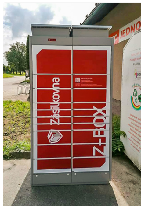
| Z-BOX stojí ve Člunku vedle prodejny potravin.

Zásilkovna uvádí, že kurýr se pokouší dodat zásilku do Z-BOXu třikrát, tzn. tři dny po sobě. Po třetím neúspěšném pokusu zásilku zaveze týž den na nejbližší výdejní místo Zásilkovny. Zákazník obdrží SMS zprávu s instrukcemi. Na nejbližší výdejní místo je doručena i zásilka, jež se nevejde do Z-BOXu. Informaci o dostupnosti konkrétního Z-BOXu sdílí Zásilkovna s napojeným e-shopem. Nicméně k fyzickému doručování dochází se zpožděním jednoho i více dnů, kdy se kapacita mění. Zásilka čeká na vyzvednutí tři dny.