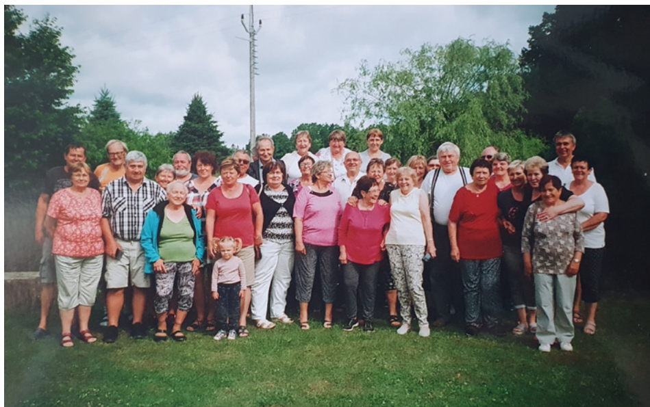
Svaz tělesně postižených z Kunžaku si užil svůj výlet na Třeboňsko.