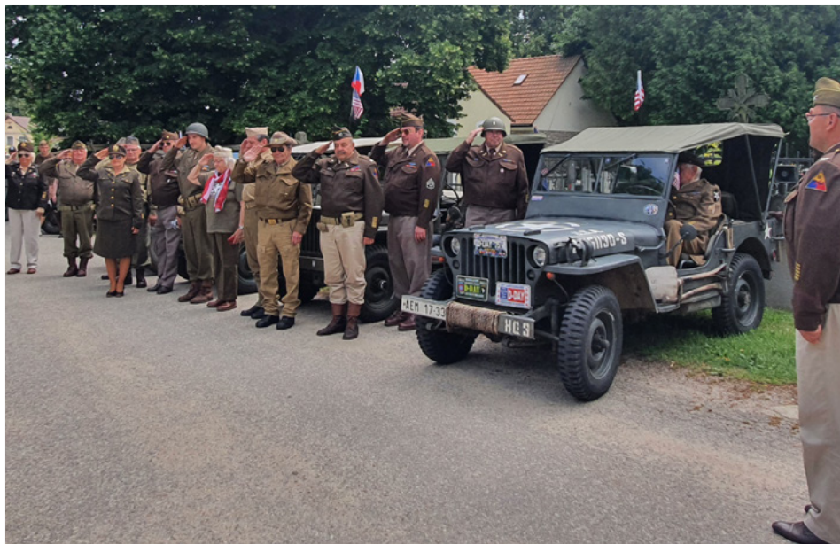
| Vojenští veteráni si společně s návštěvníky vyslechli americkou i českou hymnu. Někteří i zpívali.