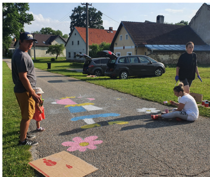
Některé děti, které viděly vilu v akci, se už těšily, až si zaskáčou panáka.