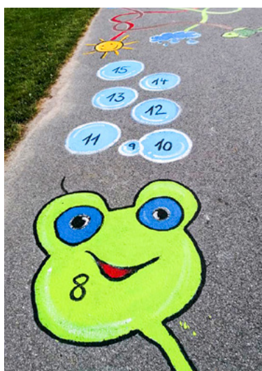
Jedna z malůvek nacházející se v Lomech.